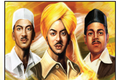
ਆਜ਼ਾਦੀ ਘੁਲਾਟੀਏ ਸ਼ਹੀਦ ਭਗਤ ਸਿੰਘ, ਰਾਜਗੁਰੂ ਅਤੇ ਸੁਖਦੇਵ ਦੇ ਸ਼ਹੀਦੀ ਦਿਹਾੜੇ ਤੇ 'ਦੇਸ਼ ਦੁਆਬਾ' ਵੱਲੋਂ ਕੋਟਿਨ-ਕੋਟਿ ਪ੍ਰਣਾਮ। (ਸੰਬੰਧਤ ਸੰਪਾਦਕੀ ਅੰਦਰ ਦੇਖੋ)

ਮੁੱਖ ਸੰਪਾਦਕ : ਪ੍ਰੇਮ ਕੁਮਾਰ ਚੰਬਰ ਸੰਪਰਕ : 916-947-8920 ਫੈਕਸ : 916-238-1393 E-mail : deshdoaba@yahoo.com ਸੰਪਾਦਕ : ਤਰਸੇਮ ਜਲੰਧਰੀ / ਵਿਵੇਕ ਭਾਟੀਆ