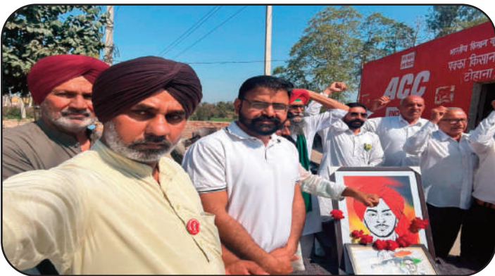
ਸ਼ਹੀਦ ਭਗਤ ਸਿੰਘ, ਸ਼ਹੀਦ ਰਾਜਗੁਰੂ ਅਤੇ ਸ਼ਹੀਦ ਸੁਖਦੇਵ ਨੂੰ 23 ਮਾਰਚ 2024 ਨੂੰ ਟੋਹਣਾ (ਹਰਿਆਣਾ) ਵਿਖੇ ਮੌਰਚੇ ਵਾਲੀ ਥਾਂ 'ਤੇ ਸ਼ਰਧਾਂਜਲੀ ਭੇਂਟ ਕਰਦੇ ਹੋਏ।