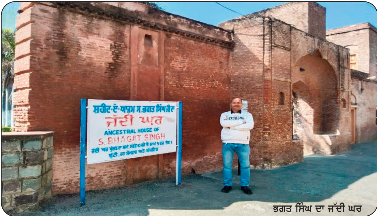
ਭਗਤ ਸਿੰਘ ਦਾ ਜੱਦੀ ਘਰ