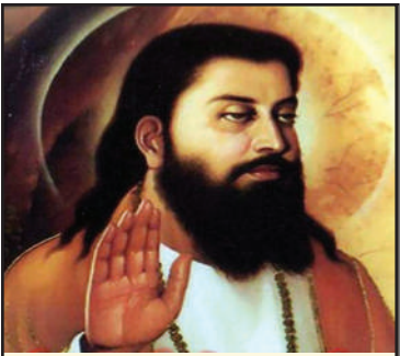
ਸ੍ਰੀ ਗੁਰੂ ਗੋਬਿੰਦ ਸਿੰਘ ਜੀ, ਜੂਝਾ ਸਿਟੀ ਵੱਲੋਂ ਤੀਜਾ ਮਹਾਨ ਨਗਰ ਕੀਰਤਨ 7 ਅਪ੍ਰੈਲ 2024 ਨੂੰ। (ਹੋਰ ਜਾਣਕਾਰੀ ਲਈ ਅੰਦਰ ਇਸ਼ਤਿਹਾਰ ਦੇਖੋ ਜਾਂ ਸੰਪਾਦਕ ਸਭਾ ਨਾਲ ਸੰਪਰਕ ਕਰੋ ਜੀ।)