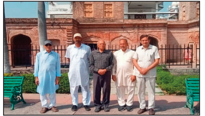
ਖਟਕੜ ਕਲਾਂ ਵਿਖੇ ਸ਼ਹੀਦ-ਏ-ਆਜਮ ਸ. ਭਗਤ ਸਿੰਘ ਦਾ ਪਿੰਡ ਅਤੇ ਜੱਦੀ ਘਰ ਭਾਰਤੀ ਵਿਦਿਅਕ ਅਤੇ ਸੱਭਿਆਚਾਰਕ ਸੰਸਥਾ ਯੂਥਾ ਸਿਟੀ (ਕੈਲੀਫੋਰਨੀਆ) ਅਤੇ ਗਦਰ ਹੈਰੀਟੇਜ ਫਾਊਂਡੇਸ਼ਨ ਕੈਲੀਫੋਰਨੀਆ ਦੇ ਮੈਂਬਰ ਸਾਹਿਬਾਨ ਨੇ ਖਟਕੜ ਕਲਾਂ ਭਗਤ ਸਿੰਘ ਦੇ ਪਿੰਡ ਅਤੇ ਜੱਦੀ ਘਰ ਵਿਖੇ ਦਰਸ਼ਨ ਕੀਤੇ ਅਤੇ ਸ਼ਰਧਾਂਜਲੀ ਭੇਂਟ ਕੀਤੀ